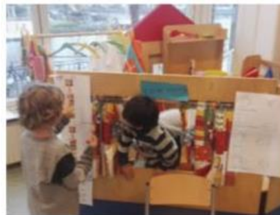
bestellen bij het koek en zopie kraam