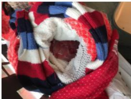
ijs zo snel mogelijk laten smelten