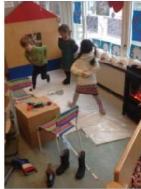
schaatsen op de ijsbaan

Vanaf de eerste week na de kerstvakantie hebben we in de kleutergroepen gewerkt met het thema 'winter'. In de winter is het fijn dat er overal ijsbanen open zijn waarop je kunt schaatsen. Wij hebben in onze klassen ook een ijsbaan geopend waar de kinderen op mochten schaatsen de afgelopen weken. Naast de ijsbaan hoort natuurlijk een koek en zopie kraam waar je na afloop op kunt warmen. Ook die was te vinden in alle kleutergroepen. Voor de warme chocolademelk met slagroom moesten prijslijsten gemaakt worden, mocht iedereen betalen met geld en kreeg iedereen ook wisselgeld terug.1052