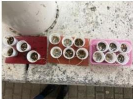
vetbollen voor de overwinterende vogels

Hoewel het nog niet heel koud is geweest deze winter hebben de vogels die overwinteren in Nederland het wel koud en is er minder voedsel voor ze te vinden. Daar hebben de kleuters ook iets op bedacht. We geven de vogels wat extra pitjes en zaadjes. Daar komen ze de winter wel mee door! Vanaf volgende week starten we met een nieuw thema, deze keer in het kader van de verbouwing het thema 'bouwen'.